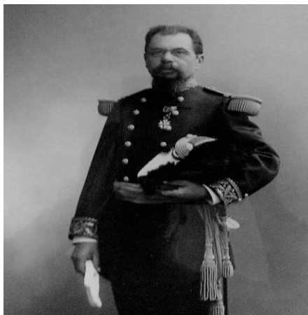
Le Général Alexis Papuchon

L'histoire de l'Acadie est complexe à saisir. Cette colonie française fondée en 1604 devient anglaise en deux étapes, 1713 et 1763. Entre ces deux dates a lieu « le Grand Dérangement » (1755-1768), soit la déportation des familles restées en territoire anglais après 1713. Différents groupes de ces exilés se retrouvent disséminés en Nouvelle Angleterre, en Louisiane, en Guyane, dans les Caraïbes et pour plus de 3000 d'entre eux en France.