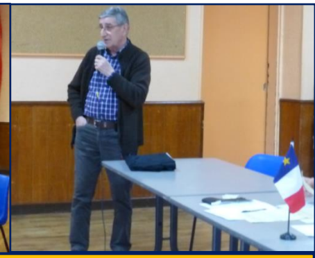
M. le Maire de La Puye

Le verre de l'amitié a permis , dans la bonne humeur et la convivialité, de siffler la fin de cette sympathique AG