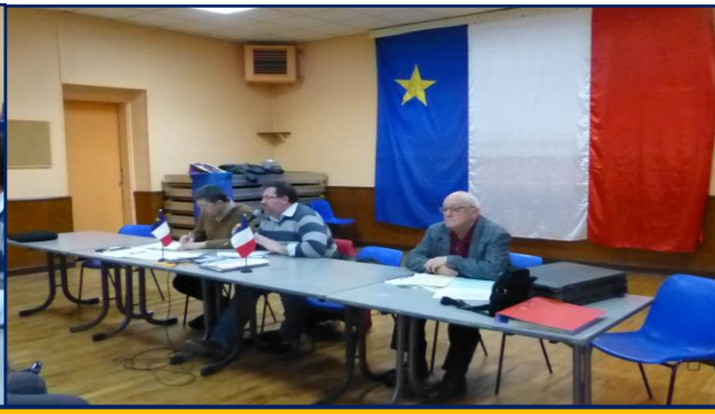
Ecoute attentive des conclusions des maires