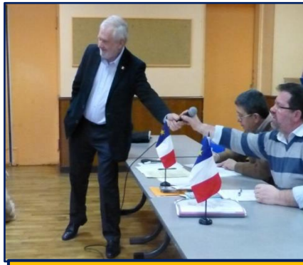
M. le Maire d'Archigny