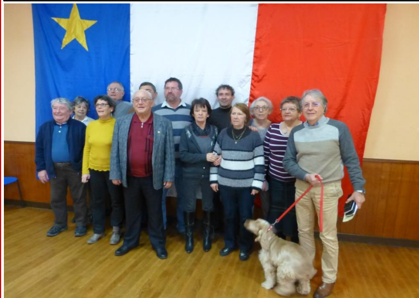
Le Conseil, presque au complet, avec sa mascotte.

MAIRIE – 38, RUE ROGER FURGE 86210 ARCHIGNY - FRANCE